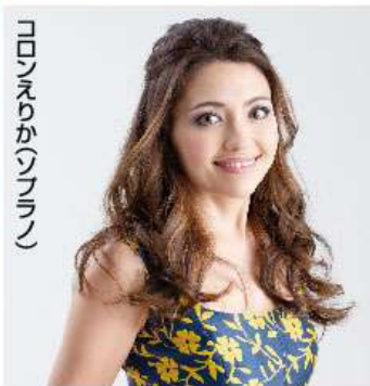
コロネりか(ソプラノ)