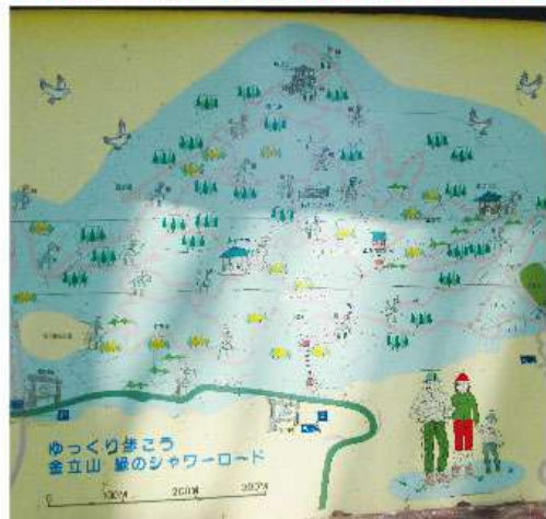
緑のシャワーロード案内図