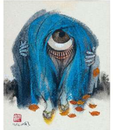
池田龍雄《絵本「幼年民話 おばけはなし」表紙原画》 伊万里市民図書館蔵