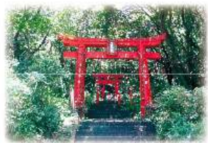
正現稲荷神社の鳥居