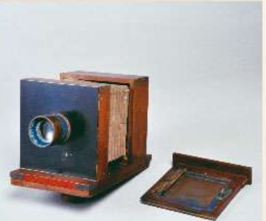
佐賀藩精煉方製作「幕末 湿板カメラ」(公財)鍋島敬效会所蔵