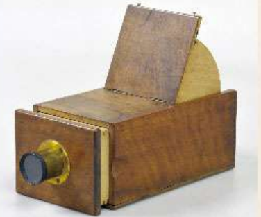
カメラオプスクラ 日本カメラ博物館所蔵