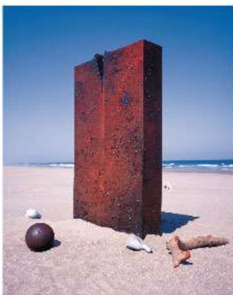
池田龍雄《凍着》2001年 個人蔵