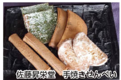
佐藤昇栄堂 手焼きせんべい