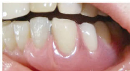
ノンクラスプデンチャー(保険外)

その他の特徴としては、入れ歯の赤い床が従来の保険の入れ歯の様に硬いプラスチックではなく、 柔らかく薄い素材 です。大半の人が※軽くて付け心地が良いと言われます。(※当院調べ)