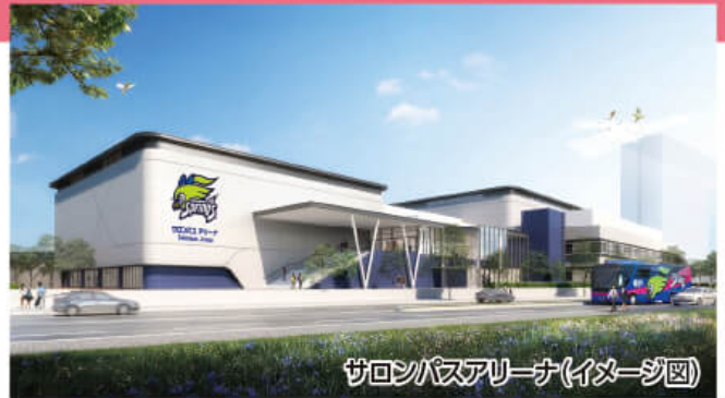
サロンバスアリーナ(イメージ図)

交通の要衝である「鳥栖」は 物流もスポーツも盛んな街です! ぜひご家族で初夏の「鳥栖」をお楽しみください!