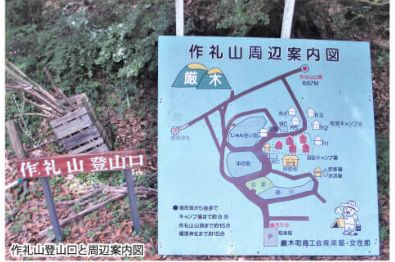
作礼山登山口と周辺案内図