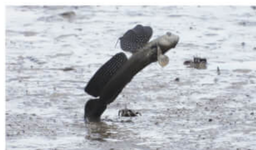
飛び跳ねるムツゴロウ

と間近でムツゴロウやカニ類を見ることができます。ただし、大抵の方はムツゴロウの姿を追いかけてしまうので、彼らはすぐに泥に隠れてしまい、「ムツゴロウ、居ないね～」ということになってしまいます。少し沖合の干潟で泥を掘っていると、ワラスボを