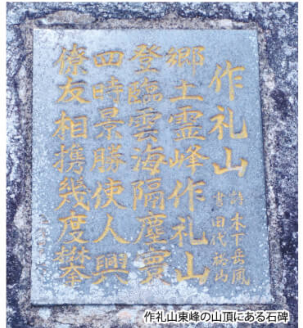
作礼山東峰の山頂にある石碑