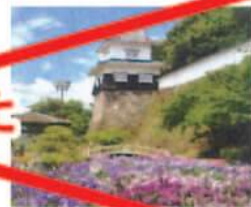
大村公園の花菖蒲

■コース距離 約10km ■所要時間/約3時間 お問い合わせ:長崎鉄道事業部(営業) 095-827-4088