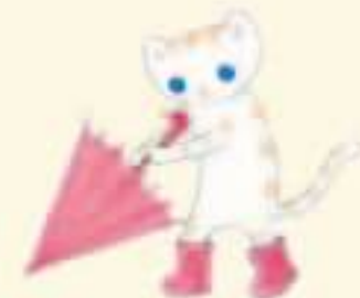
子猫のにゃーおん いたずら好き