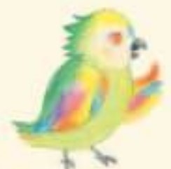
オウムのペロ 歌が上手