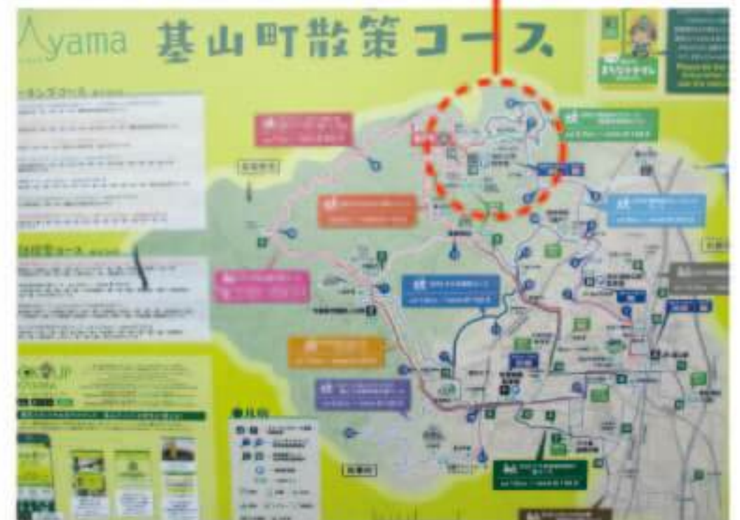
基山町散策コースマップ