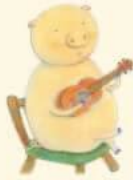
ふたのブータン のんびり屋さん