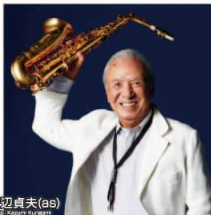
渡辺貞夫(as)