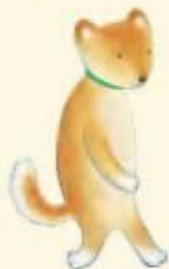
柴犬のエイキチ 真面目で世話好き