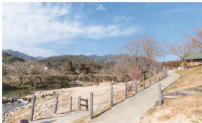
山と緑と川に囲まれた自然豊かな遊歩道!

佐賀市街地への車の玄関口とも言われる佐賀大和ICから国道263号を山の方へ5分ほど行くと、見えてくるのが道の駅大和。福岡市と佐賀市をつなぐ幹線道路として、車の往来も多い。建物の西側には嘉瀬川が流れ、川のせせらぎの音を耳にしながら整備された遊歩道を散策することもできる。ベンチも設置されているので、のんびりと景色を眺めて休憩するのもオススメ。