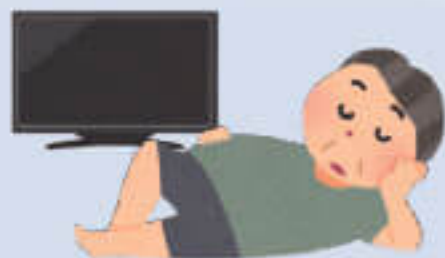
外出も少なく家でTVばかり

動かない毎日が続いたら… 心身の活力が衰える フレイル (虚弱)の影が忍び寄ります。