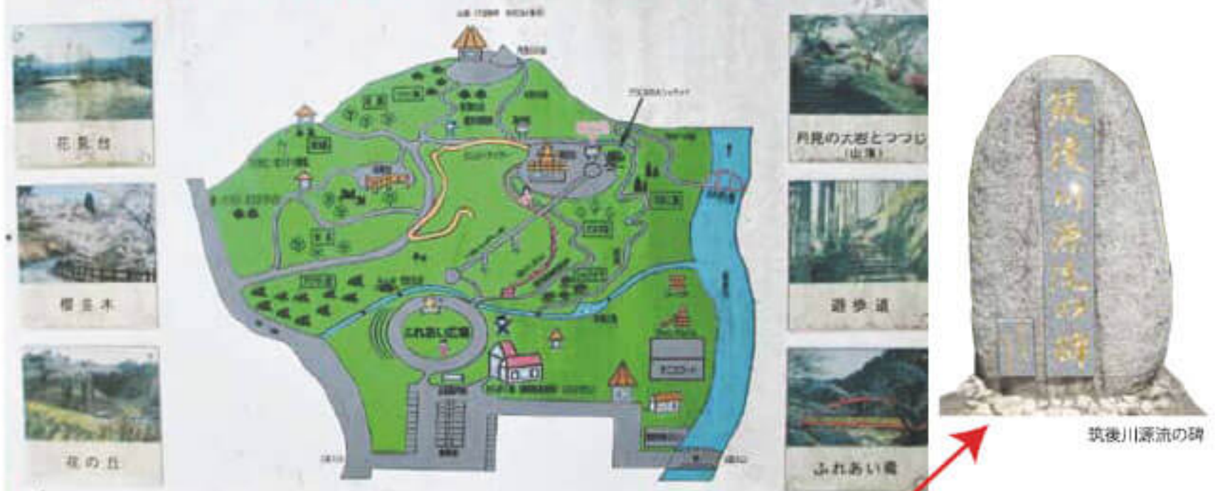
高取山公園の案内図