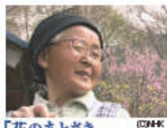
「花のあとさき ムツばあさんの歩いた道」