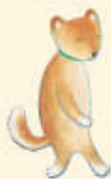
柴犬のエイキチ 真面目で世話好き