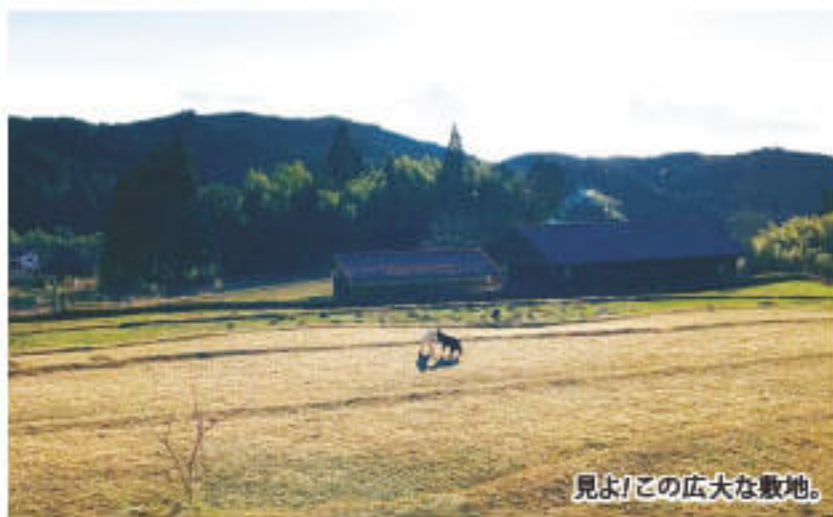
見よ！この広大な敷地。

オーナーの愛犬6匹が、スタッフみたいに「いらっしゃいっ！」と元気よく出迎えてくれるのも味わいのひとつ。みんな、穏やかで元気です。