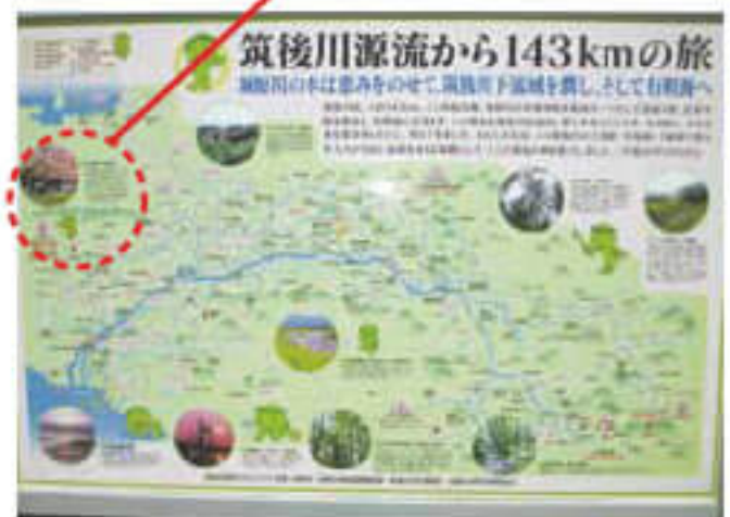
筑後川源流から143kmの旅

コースの情報を調べたり、最悪な状態を想定して装備を用意するなど事前の準備をしっかりと行い、経験豊富なしっかりしたリーダーの基で行動しましょう。山登りは自己責任である事を認識して行動してください。