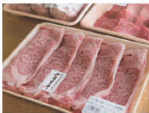
敷地内の畜産加工所では多彩なお肉も発売中

フルーツの里として知られる道の駅。梨やぶどう、イチゴ、キンカンなど、四季折々の果物はみずみずしく、見た目からもその新鮮さがうかがえる。豊かな土壌と温暖な気候が育んだ伊万里梨は、幸水、豊水、新高、あたごをメインに夏から秋まで購入可能。ぶどうは巨峰のほか、近年はシャインマスカットも人気を集めている。フルーツを用いた加工品も充実しており、いちじくや桃など伊万里産のフルーツで作ったフルーツジャムや、スパイシーな風味に伊万里梨の甘味がふんわりと香る伊万里梨カレー、果実味と香りが芳醇な「恋する梨ワイン」、JAと酒造会社のコラボレーション商品『金柑カスターラ』など、フルーツの優しい味わいを活かした商品がズラリと並ぶ。ほかにも、加工品の中で注目したいのが『伊万里グリーンカレー』。特産の小葱を使った爽やかな辛さがクセになる味わいで、リピーター続出!TVの料理コンテストでもグランプリを受賞したヒット商品だ。さらに、伊万里と言えば欠かせない「伊万里牛」。敷地内には、産地ならではの価格で購入できる直売所や、バーベキュー感覚で気軽に楽しめる焼肉ハウスなどグルメ施設も充実。