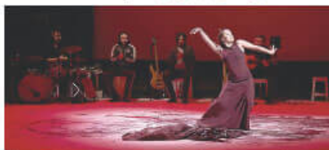
「ロシオ・モリーナLIVE カイダ・デル・シエロ」