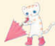
子猫のにゃーおん いたずら好き