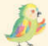
オウムのパロ 歌が上手