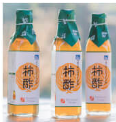
特産の柿を使った「柿酢」などオリジナル商品がいっぱい!

ちょっとした買い物から、家族での夏のレジャー、グループでの気軽なアウトドアにもぴったりの道の駅だ。