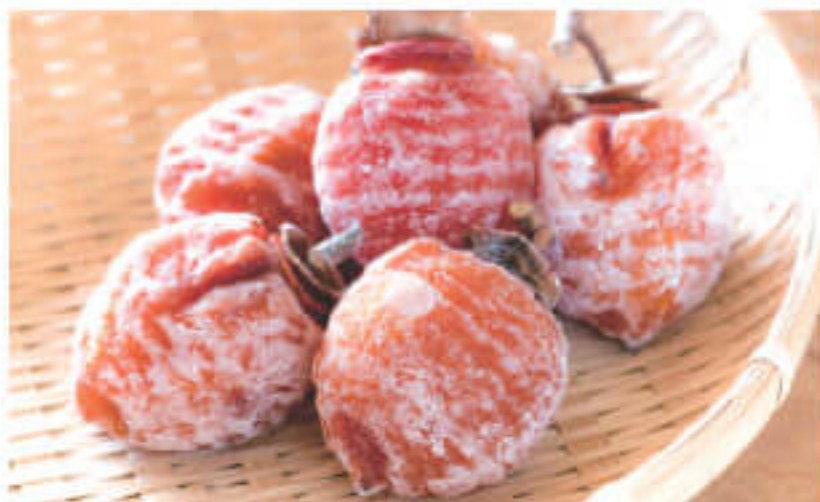
30年間の伝統がある昔ながらのほし柿

地元生産者の新鮮な野菜が一番の売り。佐賀市街からも近いので、日常の買い物で足を延ばしてくる常連客も多いそう。松梅地区の特産は「ほし柿」。県下屈指の産地ゆえ、こちらでは約15軒の生産者のほし柿を扱っている。最盛期を迎える冬場には、オレンジ色のカーテンがあちらこちらで見られる。ほし柿以外にも、柿にちなんだ冷凍のほし柿やほし柿ソフトクリーム、オリジナルの柿酢は通年取り扱っている。