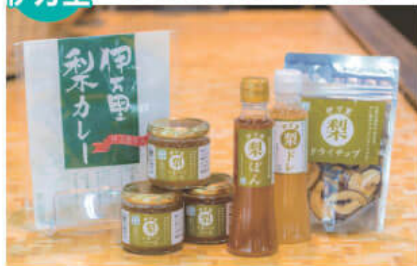
特産の梨を使ったアイデア商品たち

フルーツの里として知られる道の駅。梨やぶどう、イチゴ、キンカンなど、四季折々の果物はみずみずしく、見た目からもその新鮮さがうかがえる。豊かな土壌と温暖な気候が育んだ伊万里梨は、幸水、豊水、新高、あたごをメインに夏から秋まで購入可能。ぶどうは巨峰のほか、近年はシャインマスカットも人気を集めている。フルーツを用いた加工品も充実しており、いちじくや桃など伊万里産のフルーツで作ったフルーツジャムや、スパイシーな風味に伊万里梨の甘味がふんわりと香る伊万里梨カレー、果実味と香りが芳醇な「恋する梨ワイン」、JAと酒造会社のコラボレーション商品『金柑カスターラ』など、フルーツの優しい味わいを活かした商品がズラリと並ぶ。ほかにも、加工品の中で注目したいのが『伊万里グリーンカレー』。特産の小葱を使った爽やかな辛さがクセになる味わいで、リピーター続出!TVの料理コンテストでもグランプリを受賞したヒット商品だ。さらに、伊万里と言えば欠かせない「伊万里牛」。敷地内には、産地ならではの価格で購入できる直売所や、バーベキュー感覚で気軽に楽しめる焼肉ハウスなどグルメ施設も充実。