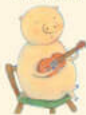
ふたのプータン のんびり屋さん