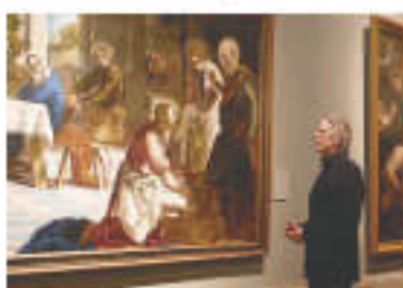
「ブラッド美術館驚異のコレクション」