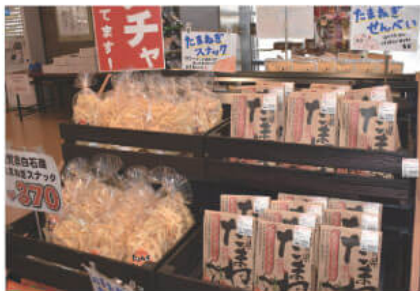
特産品のれんこんや玉ねぎを使用した 6次産品の数々は、どれも目を引くものばかり!

また、白石町といえば、地域の特産品を活かした6次産品が盛んなことでも有名。蓮根を用いた「れんこんかるかん饅頭」「根菜の濃縮パック」「レンコンチップス」や、玉ねぎを用いた「たまねぎせんべい」など盛りだくさん。老若男女問わず、誰もがお気に入りの一品を見つけられるはず!