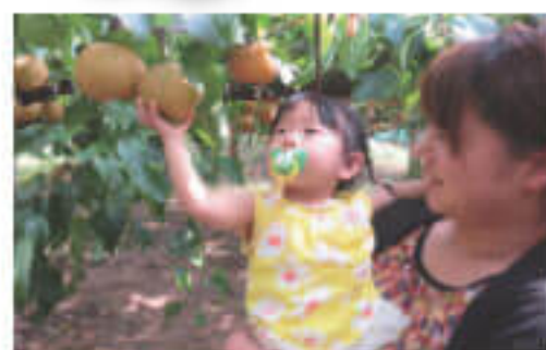
もぎたての梨はみずみずしい味わい

梨やぶどう、りんご、きんかんとそれぞれが旬を迎える時期には、フルーツ狩り体験も開催される。自分でもぎ取ったフルーツの味わいは格別!家族や友人と、思い出に残るひとときを過ごそう。