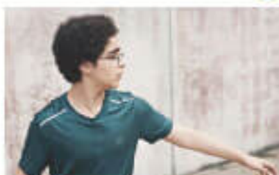
「その手に触れるまで」